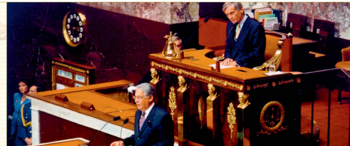
Allocution dans l'hémicycle de Fernando Henrique Cardoso, Président de la République fédérative du Brésil, le 30 octobre