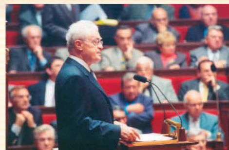
Lionel Jospin à la tribune, le 3 octobre