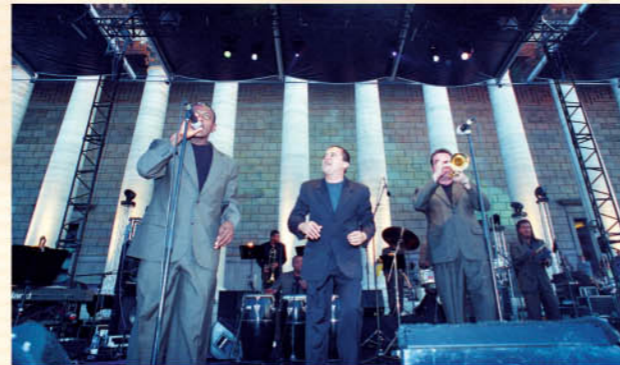
Yuri Buenaventura sur scène

Mais la passion de la musique se vit également au quotidien. C'est pourquoi, le 29 octobre, l'Assemblée a accueilli, pour la première fois au Palais Bourbon, les Assises nationales des jeunes musiciens, manifestation organisée par la Confédération musicale de France (CMF), qui rassemble 700 000 personnes à travers 5 500 écoles ou associations. Lors de cette journée, conclue par un concert donné dans la Galerie des fêtes, 200 jeunes, venus de toutes les fédérations musicales régionales de France, se sont retrouvés pour partager leurs expériences et leur engagement associatif autour d'une passion commune : la musique.