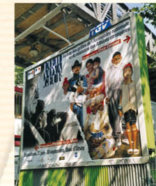
Campagne d'affichage pour l'exposition «L'Œil voyageur»

L'objectif était ambitieux : lancer un message de paix et d'amitié aux peuples du monde, appeler au respect des cultures afin de mieux partager nos différences. «Il est bon que la France rappelle d'une seule et même voix qu'elle demeure la patrie des droits de l'homme et la terre de la liberté, de l'égalité et de la fraternité, ces grandes valeurs de la République» déclaraient ensemble le Président Raymond Forni et le ministre des Affaires étrangères, Hubert Védrine.