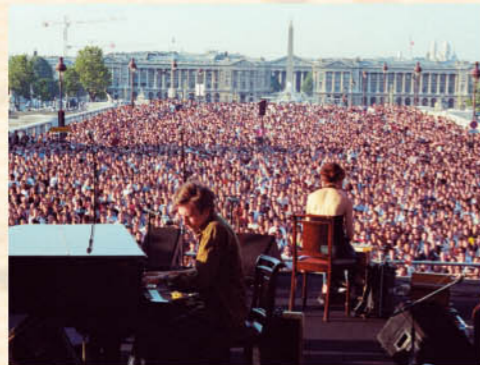
Yann Tiersen au piano

C'est le premier jour de l'été que la Fête de la musique a célébré cette année ses 20 printemps. Sous le ciel étoilé de Paris, devant la place de la Concorde et la Seine, sur une scène de 200 m 2 installée sur les marches de l'Assemblée, se sont succédés Yann Tiersen, le prince de la salsa Yuri Buenaventura, les Français rockeurs de FFF et le rappeur Dee Nasty, tous réunis pour partager avec plus de 20 000 personnes, un grand moment de joie, de plaisir et de tolérance.