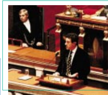
M. Yves Cochet, président de la délégation à la communication

Embrasser le nouveau siècle, c'est aussi pour l'Assemblée mettre à jour ses outils plus traditionnels de travail. Adaptation de toutes les procédures comptables aux nécessités de l'euro, introduction de la carte sésame, rénovation du PC santé, sont autant de signes tangibles d'une attention journalière aux possibilités ouvertes par les nouvelles technologies.