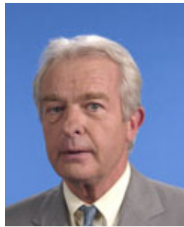
Christian CABAL, Député de la Loire Rapporteur de l'OPECST