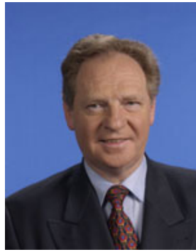
Claude BIRRAUX, Député de Haute-Savoie