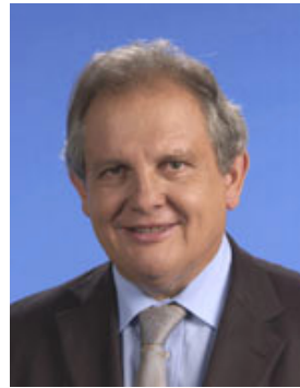
Jean-Yves LE DÉAUT, Député de Meurthe-et-Moselle