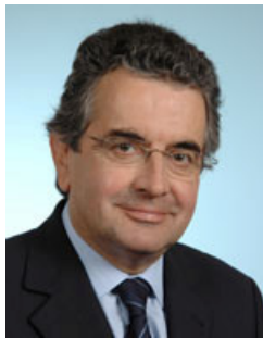
Alain CLAEYS, Député de la Vienne