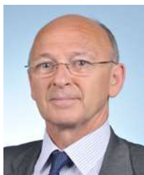
M. Claude de GANAY Député Membre de l'OPECST Rapporteur