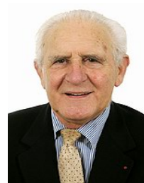
Marcel DENEUX, Sénateur de la Somme Vice-président de l'OPECST

Jeudi 22 mai 2014 9 heures à 12 h 45 à l'Assemblée nationale Salle Lamartine 101 rue de l'Université - Paris 7 ème