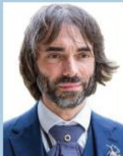
© CC BY-SA 4.0 Cédric Villani Député Premier vice-président