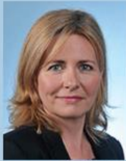
Émilie Cariou Députée