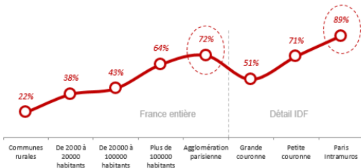
VARIATION DU CHOIX RESENTI DE MODE DE TRANSPORT EN FONCTION DE LA TAILLE DE L'AGGLOMÉRATION DE RÉSIDENCE