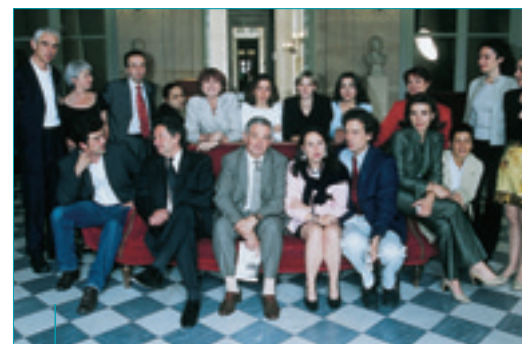
L'équipe de LCP-AN.

Mais la vie parlementaire et démocratique ne se résumant pas, loin s'en faut, à l'enceinte de l'Assemblée, il était nécessaire d'aller plus loin avec une véritable chaîne thématique parlementaire et civique, faisant toute leur place aux débats de société, aux interviews en plateau, et, surtout, aux reportages permettant de mesurer sur le terrain l'impact quotidien du travail parlementaire. La mission centrale de "La Chaîne Parlementaire" était ainsi clairement fixée, le 8 février 2000, par le Bureau de l'Assemblée : "rendre compte de la diversité du travail quotidien des députés".