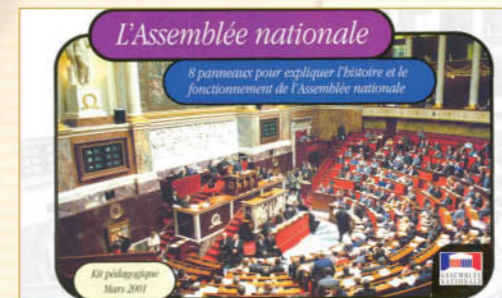
Le kit pédagogique

Enfin, parce que les outils modernes de communication sont souvent les plus attractifs pour les jeunes, le site internet propose depuis peu un espace pédagogique et ludique refondu, préfigurant la mise en place d'un «site parlementaire junior». Cet espace permet notamment d'accéder à une version multimédia du «kit pédagogique» mis à la disposition des députés.