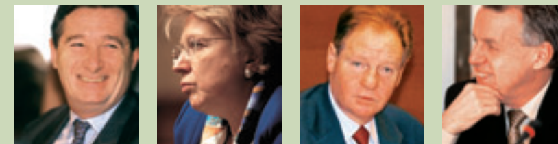
Ci-dessus de gauche à droite :

Les offices parlementaires sont des instances communes aux deux assemblées. Composés à parité de députés et de sénateurs, ils sont chargés d'une mission d'expertise et d'information. L'office parlementaire d'évaluation des choix scientifiques et technologiques (OPECST). Composé de 18 députés et 18 sénateurs, il a pour mission d'informer le Parlement des conséquences des choix à caractère scientifique et technologique. L'office parlementaire d'évaluation des politiques de santé (OPEPS), créé par la loi de financement de la Sécurité sociale pour 2003, est composé de 12 députés et 12 sénateurs, assistés d'experts dans le domaine de la santé publique.