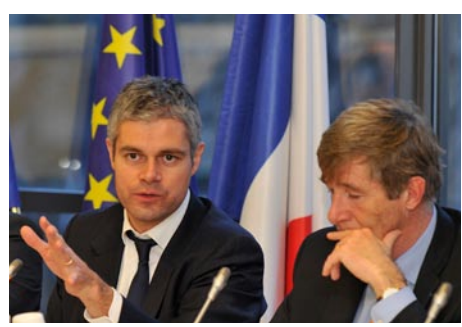
Laurent Wauquiez, Ministre chargé des affaires européennes, et Pierre Lequiller, Président de la Commission des affaires européennes