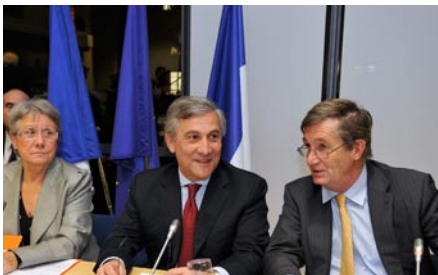
Antonio Tajani, Vice-Président de la Commission européenne, et Pierre Lequiller

Dans un même esprit, les rapports législatifs sur les projets et propositions de loi nationale comportent, lorsque le sujet le justifie, une annexe présentant leur dimension européenne.