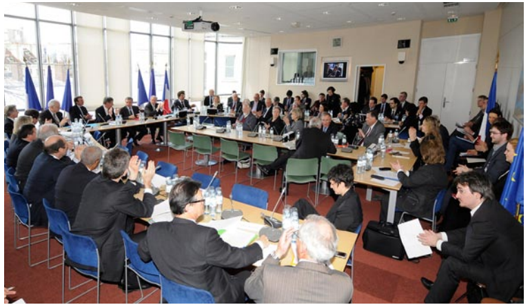
Réunion conjointe de la CAEU avec les membres français du Parlement européen, ouverte par le Président Bernard Accoyer (31 mars 2010)

Sur ces textes, la CAEU peut approuver ou rejeter la proposition européenne. Elle peut à cette occasion adopter des conclusions ou, lorsque l'importance du sujet le motive, déposer une proposition de résolution.