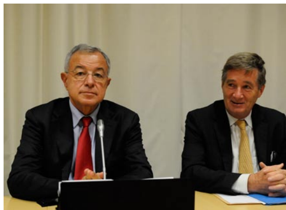
Alain Lamassoure, Président de la Commission des budgets du Parlement européen, et Pierre Lequiller