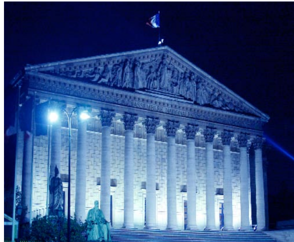
L'Assemblée nationale illuminée aux couleurs de l'Europe à l'occasion du 9 mai, journée de l'Europe

La Commission des affaires européennes (CAEU) a une mission profondément originale. A la différence des commissions permanentes, dont la vocation principale est de préparer l'examen et le vote en séance publique de la législation, la CAEU exerce un contrôle avant tout politique sur les activités européennes du Gouvernement. Son travail s'est cependant considérablement étendu depuis une dizaine d'années. Entretien désormais un dialogue direct et régulier avec les institutions européennes, en particulier le Parlement européen, et avec ses homologues étrangers, et grâce à une très étroite collaboration avec les commissions spécialisées de l'Assemblée, elle s'attache à sensibiliser et éclairer les députés sur les enjeux européens et à porter au niveau européen les priorités françaises.