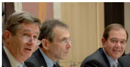
Andris Piebalgs, Comisario Europeo de Energía (en el centro)

La Comisión encargada de los asuntos europeos difunde una vez al mes entre un amplio público un boletín informativo electrónico . Varias secciones temáticas permiten un acceso rápido y completo a la totalidad de los trabajos de la Comisión. Los destinatarios del boletín electrónico también pueden informarse acerca de los trabajos y la posición de la Comisión sobre cada uno de los «documentos E» sometidos a la Asamblea Nacional de acuerdo con el artículo 88-4 de la Constitución, gracias a la presentación en la red de una ficha específica para cada documento examinado. La Comisión recibe anualmente cerca de 3 000 documentos europeos (proyectos de reglamentos, directivas, resoluciones, Libros blancos, Libros verdes, comunicaciones, programas de trabajo...). Una selección comentada de dichos documentos se publica mensualmente en el boletín electrónico.