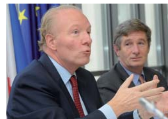
Brice Hortefeux, Ministro de Inmigración, Integración, Identidad Nacional y Desarrollo Solidario