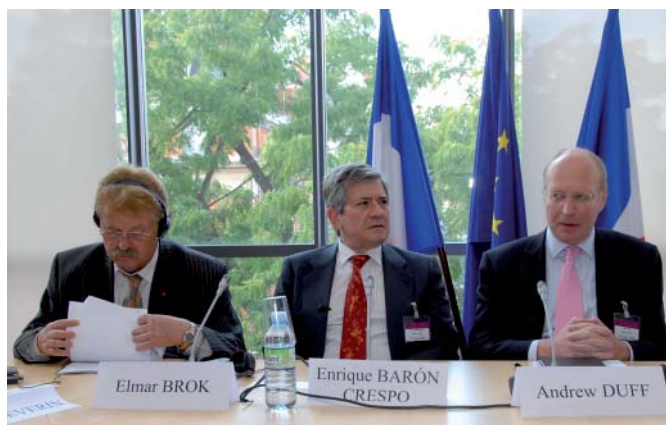
Reunión de trabajo con tres representantes del Parlamento Europeo