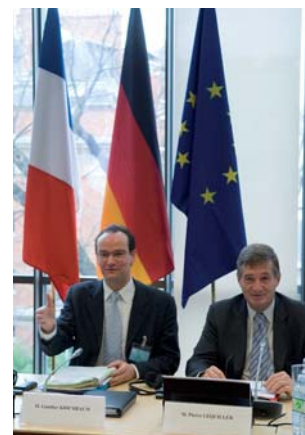
Reunión francoalemana, copresidida por Gunther Krichbaum, Presidente de la Comisión de Asuntos de la Unión Europea en el Bundestag, y Pierre Lequiller

En el plano multilateral, el desarrollo de las relaciones interparlamentarias se organiza dentro de la COSAC, que reúne semestralmente en el país que ejerce la presidencia de la Unión Europea, a seis representantes de las Comisiones encargadas de los asuntos europeos de los Parlamentos de la Unión, y a seis representantes del Parlamento Europeo.