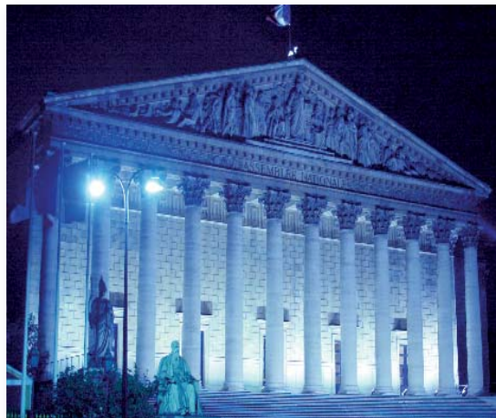
La Asamblea Nacional iluminada con los colores de Europa, con motivo del Día de Europa

La Comisión encargada de los asuntos europeos tiene una misión profundamente original. A diferencia de las comisiones permanentes cuyo papel es preparar el examen y la votación en sesión pública de la legislación, la Comisión encargada de los asuntos europeos ejerce un control sobre las actividades europeas del Gobierno. Su trabajo se ha ampliado considerablemente desde hace unos diez años. Mantiene ahora un diálogo directo y regular con las instituciones europeas y sus homólogas extranjeras, por lo que se dedica a sensibilizar e informar a los diputados sobre los retos europeos. A estos fines se ha hecho en área de experiencia e iniciativa en Europa.