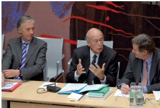
Audiencia de Valéry Giscard d'Estaing sobre el Tratado de Lisboa

La implicación de los Parlamentos nacionales en los asuntos europeos se acompaña de un fortalecimiento de la cooperación entre las instituciones parlamentarias nacionales y europeas. Los diputados son cada vez con mayor frecuencia invitados a Bruselas para debatir sobre varios temas con los miembros de alguna comisión permanente del Parlamento Europeo. Con el mismo espíritu, la Comisión encargada de los asuntos europeos de la Asamblea Nacional invita regularmente a los diputados franceses del Parlamento Europeo a participar en reuniones conjuntas. Paralelamente la cooperación parlamentaria bilateral no deja de intensificarse y la Comisión encargada de los asuntos europeos organiza muy regularmente reuniones conjuntas con sus homólogos europeos. La creación de una plataforma electrónica de intercambio de información entre los Parlamentos nacionales (IPEX) permite reforzar la eficacia del control parlamentario con respecto, en particular, al cumplimiento del principio de subsidiariedad.