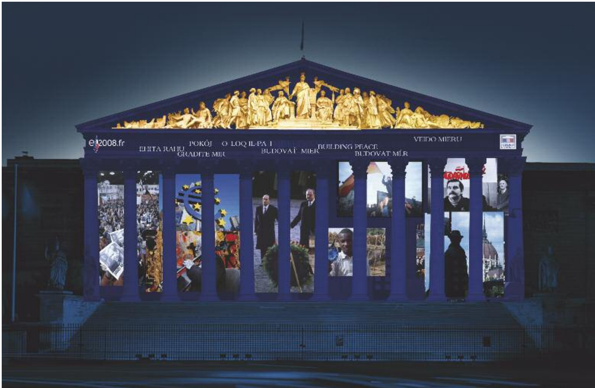
Extrait du film projeté sur la colonnade de l'Assemblée nationale à l'occasion de la Présidence française de l'Union européenne. Ce visuel libre de droit est contenu dans le DVD joint à ce dossier de presse.