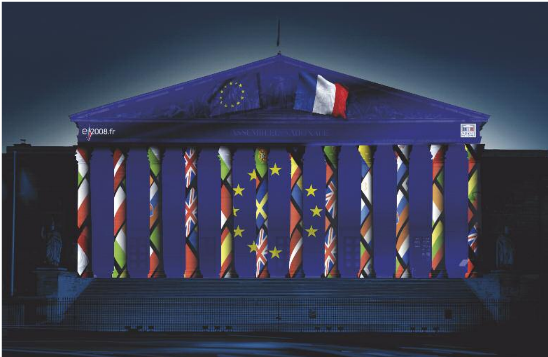
Extrait du film projeté sur la colonnade de l'Assemblée nationale à l'occasion de la Présidence française de l'Union européenne. Ce visuel libre de droit est contenu dans le DVD joint à ce dossier de presse.