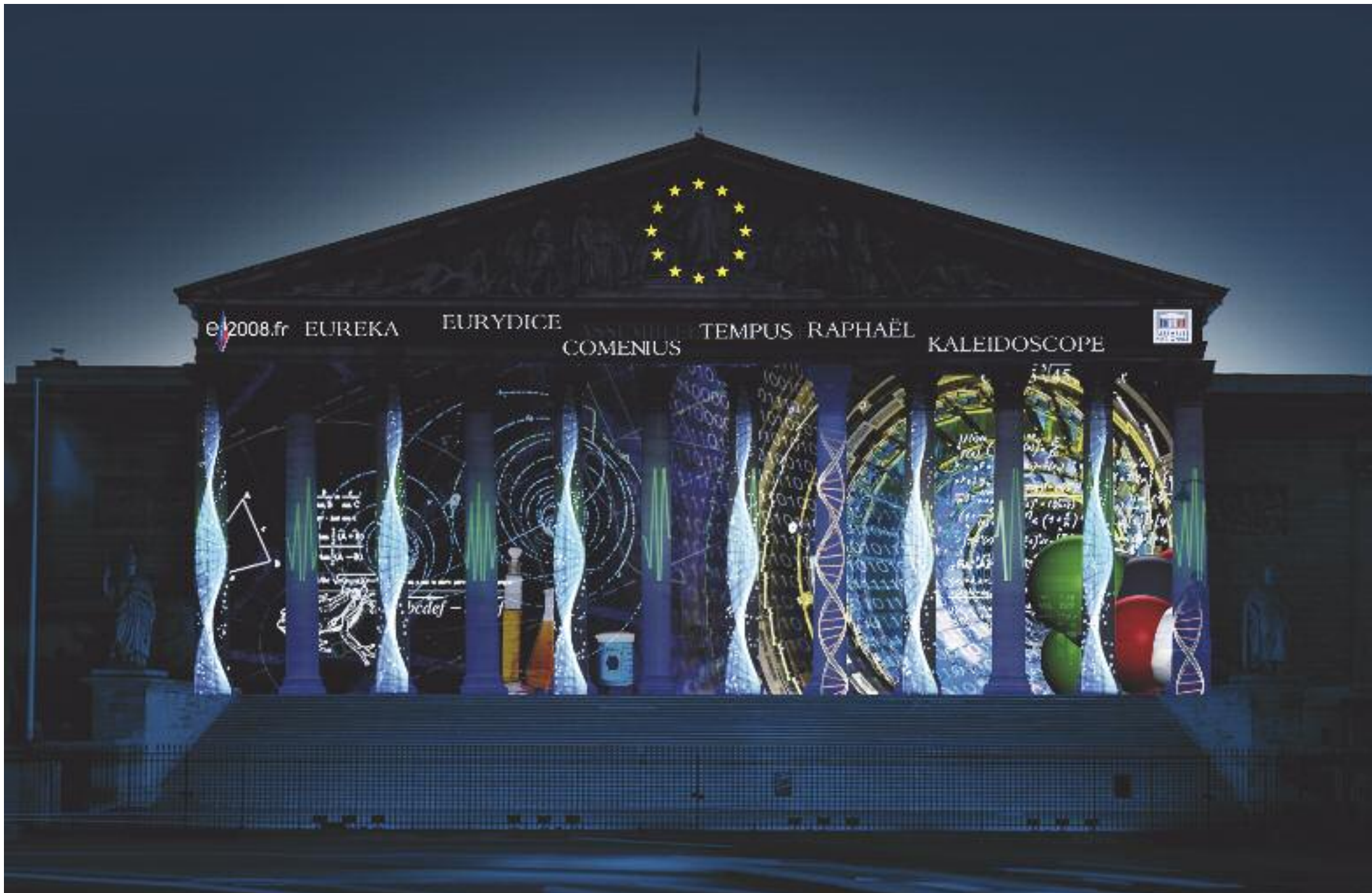
Extrait du film projeté sur la colonnade de l'Assemblée nationale à l'occasion de la Présidence française de l'Union européenne. Ce visuel libre de droit est contenu dans le DVD joint à ce dossier de presse.