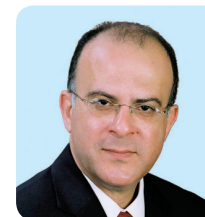
Le Président de la Vouli ton Antiprosópon, Marios Garoyian

Les élections législatives de 2006 ont consacré le maintien au pouvoir de la coalition de gauche formée par l'AKEL (communiste) et ses alliés libéraux, de gauche, du centre et écologistes. Les Chypriotes ont confirmé ce choix politique en 2008, en élisant Président de la République Dimitris Christofias , leader du Parti communiste AKEL.