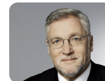
Le Président du Folketing. Thor Pedersen

Les élections anticipées de novembre 2007 ont permis à la coalition sortante libérale-conservatrice, conduite par le Premier ministre Anders Fogh Rasmussen , d'obtenir une majorité de sièges au sein du Folketing. Cependant, cette majorité n'étant que relative, le Gouvernement, au terme d'un accord de soutien sans participation, s'appuie depuis le début de la législature sur une coalition élargie au parti Nouvelle alliance (NY, centre-droit) et au Parti populaire danois (DF, nationaliste).