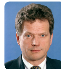
Le Président de l'Eduskunta, Sauti Niinistö

Les élections de mars 2007 ont conforté le Parti du centre du Premier ministre Matti Vanhanen (23,1% des voix) mais ont conduit celui-ci à de nouvelles alliances, le Parti du rassemblement national (conservateur ; 22,3%) entrant dans la coalition gouvernementale tandis que le Parti social-démocrate (21,4%) en sortait. Le Parti libéral suédois (suédophone) est membre de la coalition gouvernementale qui compte deux ministres issus de ses rangs.