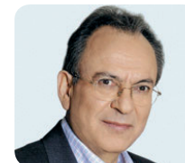
Le Président de la Voulí ton Ellínon, Dimitrios Sioufas

Les élections anticipées de septembre 2007 ont vu le maintien au pouvoir du parti Nouvelle démocratie du Premier ministre Costas Caramanlis (centre-droit), le Pasok (socialiste) demeurant dans l'opposition. Cependant, la courte majorité (41,8 %) obtenu par Nouvelle démocratie a contraint celle-ci à opérer une alliance avec les nationalistes orthodoxes du LAOS.