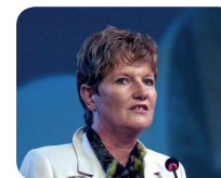
La Présidente de l'Országgyűlés, Katalin Szili

Les élections législatives d'avril 2006 ont vu le Parti socialiste hongrois conduit par Ferenc Gyurcsany , Premier ministre depuis 2004, remporter la majorité relative à l'Assemblée nationale. Le Gouvernement de Ferenc Gyurcsany s'est appuyé sur une coalition comprenant, outre les socialistes, les députés du parti libéral SzDSz jusqu'en avril 2008. Le Gouvernement est, depuis lors, minoritaire.