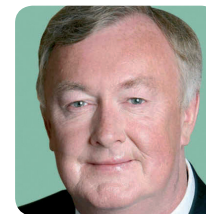
Le Président du Dáil Éireann, John O'Donoghue

Lors des élections législatives de mai 2007, les électeurs irlandais ont placé en tête le Fianna Fáil emmené par Bertie Ahern, Premier ministre depuis 1997. En mai 2008, Brian Cowen , également membre du Fianna Fáil, lui a succédé à la tête du Gouvernement. Il s'appuie sur une coalition regroupant, outre son propre parti, les démocrates progressistes et les Verts.