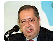
Le Président de l'Assemblée de la República, Jaime Gama

Les élections législatives anticipées de février 2005 à l'Assemblée de la République ont permis à l'opposition socialiste d'emporter la majorité absolue pour la première fois depuis la «Révolution des Œillets» (1974). Investi par l'Assemblée, le gouvernement de José Socrates (socialiste) est entré en fonction le 13 mars 2005.