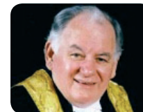
Le Président de la House of Commons, Michael J. Martin

Les élections anticipées de mai 2005 ont vu le New Labour du Premier ministre Tony Blair remporter pour la troisième fois consécutive la majorité des sièges à la Chambre des communes. L'ancien Chancelier de l'Échiquier Gordon Brown , à l'issue d'une élection au sein du parti travailliste, a succédé à Tony Blair au poste de Premier ministre le 27 juin 2007, à mi-législature.