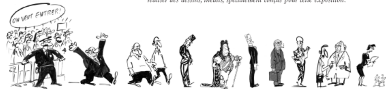
JEAN-LOUIS DEBRÉ Président de l'Assemblée nationale

Que BOLL, CABU, CALVI, PÉTILLON, PLANTU et WIAZ soient remerciés très sincèrement pour cela.