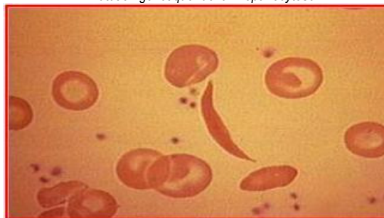
Mutation génétique de la Drépanocytose

L'insertion sociale des patients atteints de cette maladie en termes d'éducation et d'accès à l'emploi est difficile, de même que celle de leur entourage, notamment des mères qui doivent prodiguer des soins continus à leurs enfants lorsqu'ils sont atteints. Les malades de la drépanocytose s'estiment victimes de discriminations.