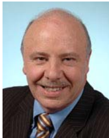
ALAIN GEST, député de la Somme