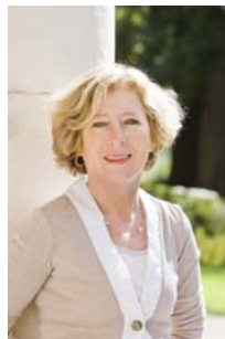
Geneviève FIORASO Députée de l'Isère