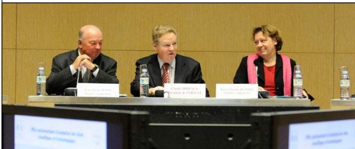
M. Jean-Pierre Door, M. Claude Birraux, président de l'OPECST et Mme Marie-Christine Blandin

Cette audition publique a permis d'aborder deux questions : Comment peut-on ralentir la propagation des virus ? Comment peut-on garantir les bons choix dans la lutte contre des virus potentiellement dangereux ? Les débats, très riches, ont permis un dialogue entre parlementaires, professeurs de médecine, chercheurs, réseaux de médecins, syndicats et représentants des autorités sanitaires : ministère de la Santé, Institut de veille sanitaire, Établissement de Préparation et de Réponse aux Urgences Sanitaires. Ces intervenants ont été confrontés à plusieurs regards croisés du terrain.