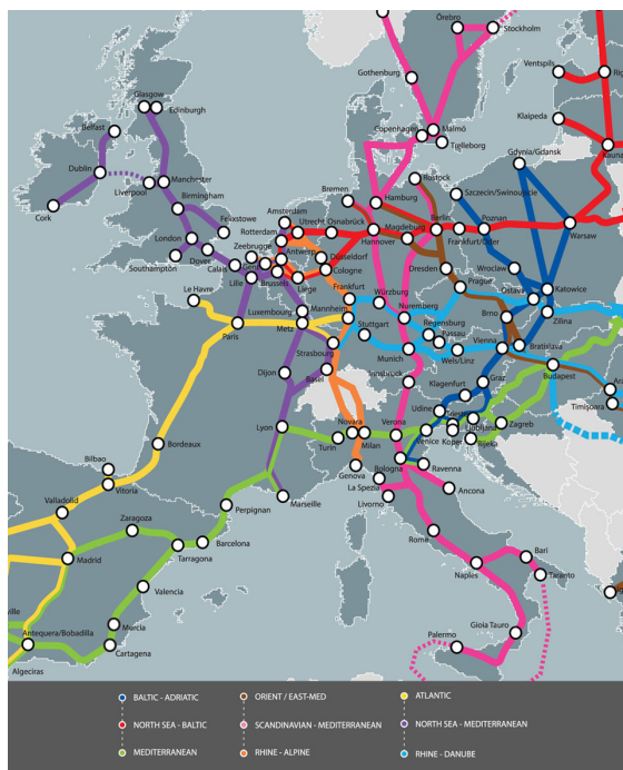
SCHÉMA DES NEUF CORRIDORS DU RÉSEAU CENTRAL

Dans le cadre du RTE-T, deux instruments relient le Royaume-Uni au reste de l'Union européenne. D'une part, le corridor de réseau central « Mer du Nord – Méditerranée » assure aujourd'hui la connectivité directe de l'Irlande à la partie continentale de l'Union européenne, et lui permet d'être pleinement intégrée au marché intérieur.