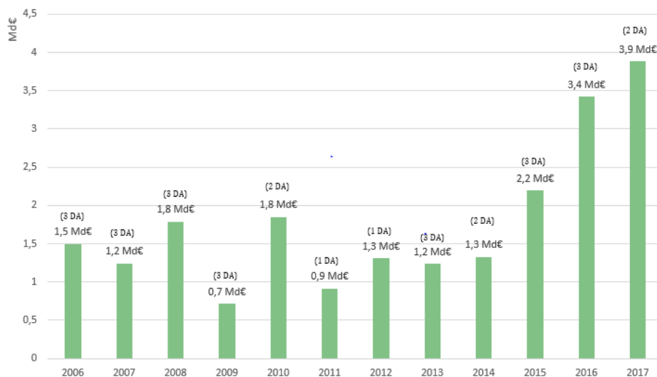
Montants des crédits ouverts par décret d'avance depuis 2006

De ce fait, et compte tenu des délais de publication de la LFR de fin de gestion, le recours aux décrets d'avance s'était accru et systématisé au cours des derniers exercices. Le niveau des crédits ainsi ouverts a également été largement augmenté. Ces ouvertures étaient justifiées par l'urgence des dépenses qui s'imposaient au Gouvernement mais cette pratique a également démontré l'insuffisante prise en compte des risques et aléas au stade de la budgétisation. De par son ampleur et sa fréquence, le recours aux décrets d'avance a également conduit à amoindrir la portée de l'autorisation parlementaire. En effet, conformément à l'article 13 de la loi organique relative aux lois de finances, les décrets d'avance ne nécessitent qu'un avis des commissions des finances des deux assemblées alors que les PLFR font l'objet d'un débat et d'un vote du Parlement sur les modifications proposées par le Gouvernement.