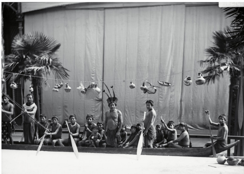
Roland Bonaparte, Portrait du groupe dans une pirogue, 1892. Musée du Quai Branly-Jacques Chirac.