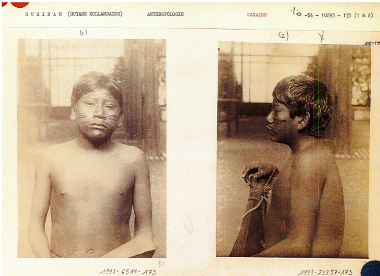
Roland Bonaparte, Portrait de Cassagne, 1892. Musée du Quai Branly-Jacques Chirac.