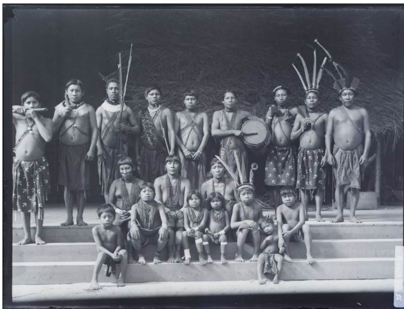
Roland Bonaparte, Portrait du groupe Kali'na posant sur les marches, 1892. Musée du Quai Branly-Jacques Chirac.