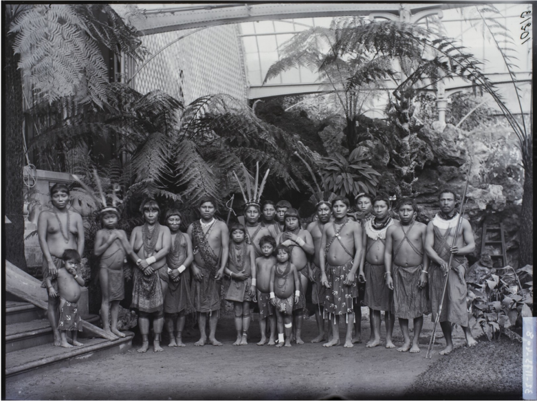
Roland Bonaparte, Portrait du groupe Kali'na posant dans la serre, 1892. Musée du Quai Branly-Jacques Chirac.