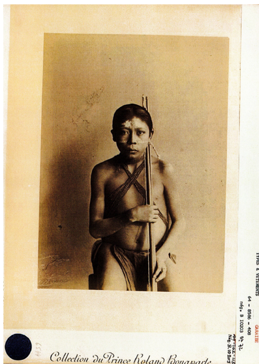
Roland Bonaparte, Portrait de Malé, 1892. Musée du Quai Branly- Jacques Chirac.