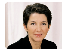
La Présidente du Nationalrat, Barbara Prammer

Les élections du 1 er octobre 2006 ont vu la victoire des sociaux-démocrates du SPO (35,7 % des suffrages exprimés), suivi des chrétiens-démocrates de l' ÖVP (34,2% des suffrages exprimés). Les Verts , qui devancent de quelques voix les nationalistes du FPÖ , sont devenus le troisième parti autrichien (11,2 %). Après une phase de consultations, un gouvernement dit de grande coalition a été formé. Alfred Gusenbauer est devenu Chancelier le 11 janvier 2007.