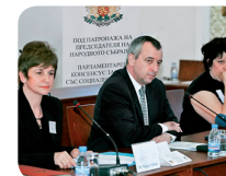
Le Président de la Narodno Sabranie, Georgiev Pirinski

Lors des élections législatives du 25 juin 2005, le Parti socialiste bulgare est arrivé en tête des suffrages (34 % des voix) devant le Mouvement national Siméon II, le Mouvement des droits et libertés (turcophone) et le parti nationaliste Ataka. Le 16 août 2005, le gouvernement de coalition proposé par Serguei Stanichev a reçu la confiance de l'Assemblée par 169 voix pour et 67 contre.