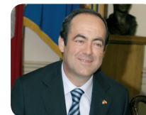
Le Président du Congreso de los Diputados, José Bono Martínez

Les élections de mars 2008 ont conforté la prééminence du PSOE (socialiste) qui a obtenu 44,1 % des voix, contre 40,6 % au Parti Populaire (PP), permettant à Jose Luis Rodriguez Zapatero de demeurer Chef du Gouvernement. Le Congreso de los Diputados compte plusieurs groupes politiques à vocation régionaliste, représentant notamment la Catalogne et le Pays basque.