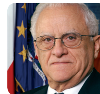
Le Président d'Il Kamra Tad-Deputati, Edward Fenech-Adami

En mars 2008, les électeurs maltais ont renouvelé leur confiance au Parti nationaliste (centre-droit pro-européen) de Lawrence Gonzi , permettant à celui-ci de demeurer dans ses fonctions de Premier ministre qu'il occupe depuis 2004 et qu'il cumule désormais avec les portefeuilles des finances et de la défense. La vie politique maltaise demeure encore aujourd'hui marquée par le modèle bipartisan britannique, les deux principaux partis de l'île détenant à eux seuls la totalité des sièges de députés.